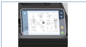
本体内蔵スマートタッチスクリーン スキャナ単体でも作業可能 よりわかりやすく、簡単作業を実現