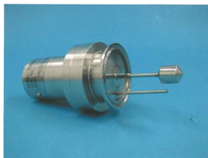
2Sフェルールプローブ