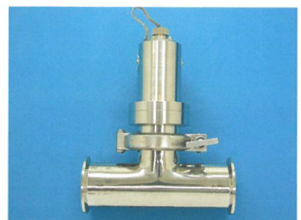
2Sサニタリーチーズ管